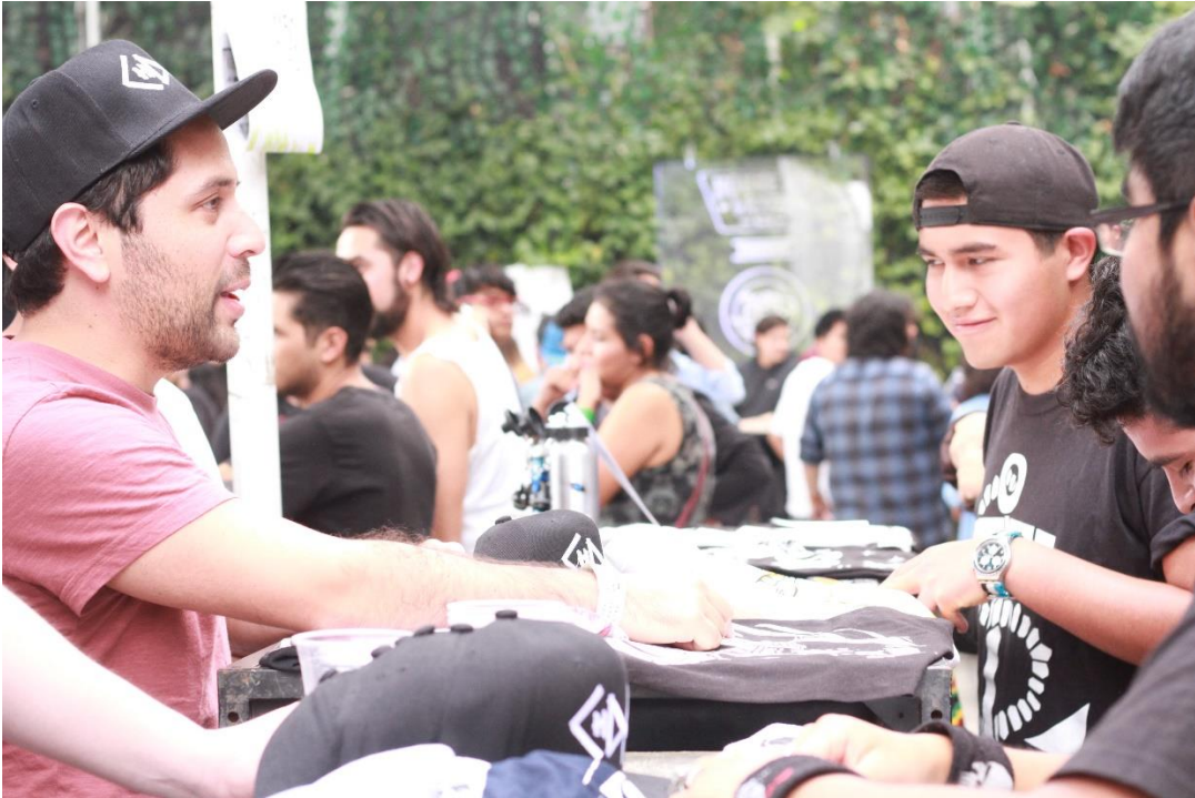
Chingadazo de Kun-Fu en el Indie Market Day, un bazar de bandas que se lleva a cabo en el Foro Indie Rock de la CDMX. 2017.

Ambas propuestas son opciones para las nuevas bandas de que puedan vender la mercancía oficial de su banda, buscar un espacio para poder preparar un set acústico y que más personas puedan escucharlos. El Indie Market Day es un evento que se realiza una vez al año gracias a Indie Rocks en el foro del mismo nombre. Desde una banda de pop hasta lo más punk rock del mundo, encontrándolos paraditos toda una tarde para que la gente se acerque a conocerlos, con agrupaciones ya un poco más reconocidas dentro de la escena, eso sí. Sin embargo, en Pizzatánicos es totalmente del circuito de bandas, ¿a qué me refiero con esto?, a que la banda que encuentras aquí, son grupos que están en el camino tocando oportunidades y a su vez, conviviendo con otros grupos que se encuentran en la misma situación y que comparten seguidores con las demás agrupaciones.