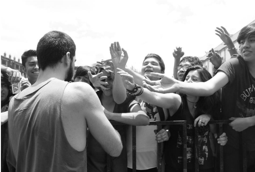
Beta en Semana de las Juventudes 2016.

En estos últimos años el género se ha reactivado; si bien ha ocurrido una gran transformación en el ámbito gracias a las nuevas tecnologías, los cambios administrativos en las mismas disqueras, o los convenios que se llevan a cabo en diversas situaciones. Además de que las condiciones sociales son un tanto