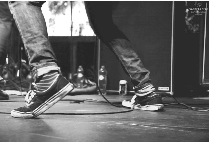
Rock N' Patria. Banda Rodeo Way. SALA, CDMX. Septiembre 2016.

youtubers . Hay bandas, y no digo que sean malas, que entre sus integrantes cuentan con algún personaje público, y sienten que por ser parte ya de un grupo de personajes públicos, tienen la escena comprada, por decirlo así. Es decir, que este sector de músicos no tiene que sufrir lo que una banda que apenas inicia de la misma forma; buscar un lugar para tocar, rentar el equipo de sonido, buscar quien ayude con la creatividad de fotografía y video, lugares de ensayo, redes sociales, difusión, etc. Un conocido me comentaba “ mmm las bandas que salen con palancas youtubers o con dinero, la mayor parte de las veces no se sienten parte de una escena ”. No se sienten parte porqué quizás ya tienen la mitad del camino recorrido. Es aquí donde entra esta idea de tu escena no es mi escena .