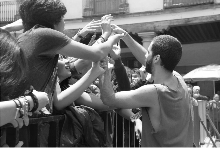
Beta en Semana de las Juventudes 2016. Santo Domingo, CDMX.

Los mercados de música independiente surgen como una nueva tendencia; un espacio que desarrolla a través de colectivos indie o alianzas, eventos a favor de la escena independiente.