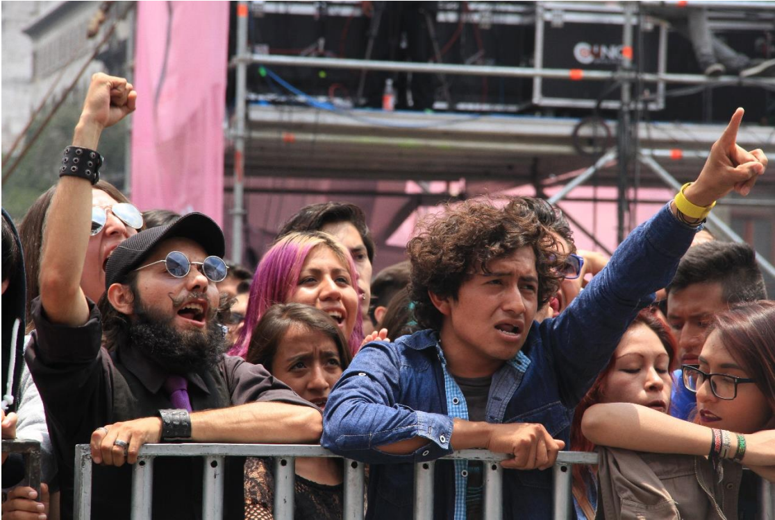
De los movimientos sociales y conciertos masivos. Zócalo CDMX, Semana de Juventudes.

Me parece que estos eventos son la columna vertebral de lo que actualmente vivimos dentro de la industria musical tan sólo en la Ciudad de México; son vestigios que permanecen para enseñarnos que la música sigue siendo una herramienta social para expresar cualquier sentimiento, y claro, protestas.