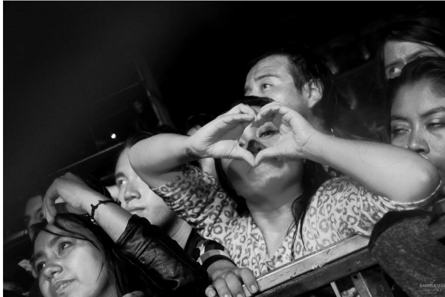
Semana de las juventudes 2017. Zócalo CDMX.

Los fans nos identificamos con los mismos músicos o las canciones. Que por qué tu novia te dejó, que te cambiaron, que empiezas una nueva etapa o la diversión con los amigos; para cada situación hay una canción. O el vocalista de X