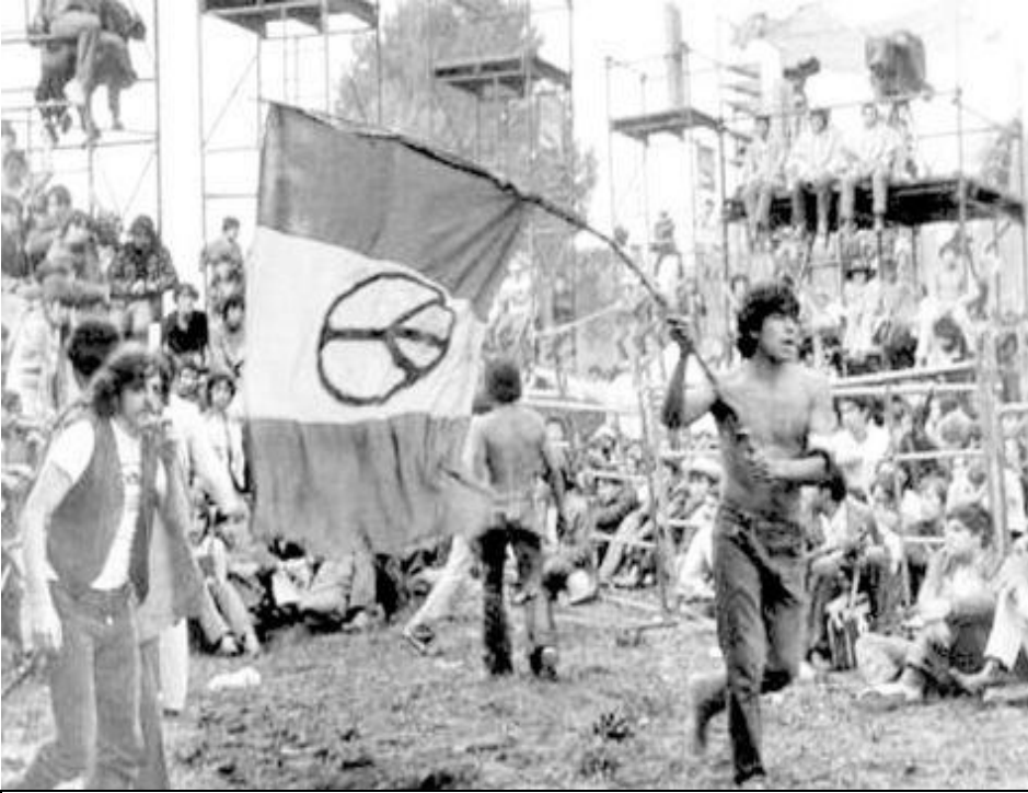
Peregrinación de jóvenes en el Festival de Avándaro.

Comenzando por el norte, se manifestaron grupos como El Ritual, banda de rock progresivo y letras en inglés, de Tijuana; Peace and Love, banda de funk y rock; estaban también Baby Bátiz que rompió con la etiqueta de niña tierna. De Nuevo León llegó La