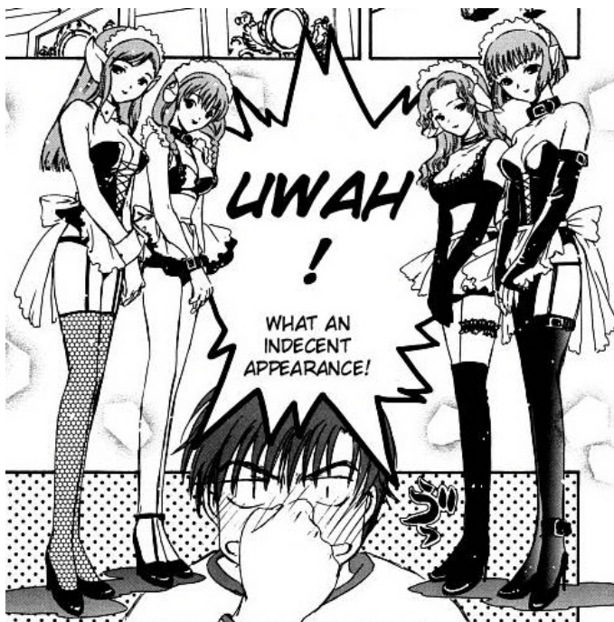
Chobits© 2001. CLAMP. Editorial Kodansha. Página 61

Esta imagen corresponde al manga dirigido a hombres “Chobits”. Estas cuatro “mujeres” se colocan en la categoría de Mujeres como “objeto sexual” debido a que la posición de ellas es completamente pasiva. Sus cabezas se encuentran ligeramente agachadas como haciendo una reverencia con una actitud sumisa.