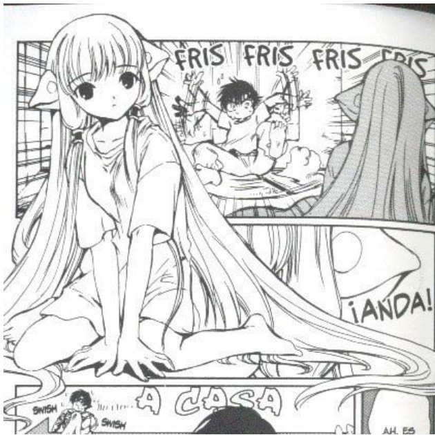
Chobits© 2001. CLAMP. Editorial Kodansha. Página 26

La siguiente imagen se encuentra en la categoría de “Mujeres en dependencia” debido a que la pose del personaje es completamente pasiva, además que es un personaje que depende todo el tiempo de los demás y no puede hacer nada por ella misma.