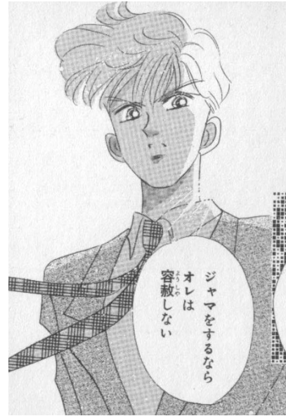
Bishoujo Senshi Sailor Moon© 1992, Naoko Takeuchi. Editorial Nakayoshi