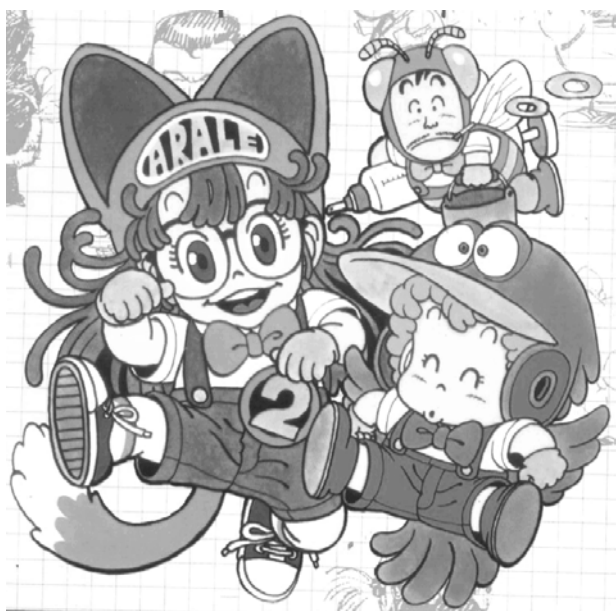
Dr. Slump© 1980. Akira Toriyama. Editorial Shueisha

Kodomo significa niño en japonés y corresponde al género infantil del manga . Va dirigido a niños de 6 a 11 años (Galicia, 1999: 7). En su haber se encuentran varias de las historias más populares en México, Estados Unidos y Japón, entre otros lugares. Tenemos el caso de Digimón, Pokémon y Yugioh 21 . Estas tres series han producido ganancias millonarias con la gama de productos