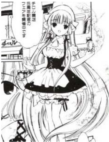
Chobits© 2001. CLAMP. Editorial Kodansha.

de semana los adolescentes y los jóvenes se reúnen para disfrazarse como sus personajes favoritos de manga . A este distrito llegaron modas europeas basadas en el estilo gótico que incorpora moda de la época victoriana y edwardiana a mitad del siglo XIX (De Rus, 2010). Hoy en día de acuerdo a palabras de De Rus (2010: 56), los jóvenes japoneses se convirtieron en grandes precursores de la moda gótica, donde las Lolitas góticas nacen de las animaciones y el manga .