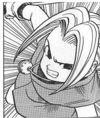
Kajika© 1998, Akira Toriyama. Editorial Shueisha. Página 17

delgada. Ayuda a Kajika a recuperar un huevo que contiene un dragón. Se presenta como una niña muy independiente, agresiva y rebelde.