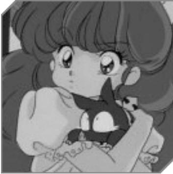
Ranma 1/2© 1987, Rumiko Takahashi. Editorial Shogakukan