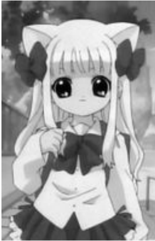
Pita Ten© 1999, Koge Donbo. Editorial ASCII MediaWorks

• Kemonomimi o chica “gato” . Este personaje femenino se caracteriza por tener rasgos de felino. Su comportamiento y vestimenta es igual al de un gato mostrándose muy amables y de un momento a otro, agresivas. Usan orejas de gato y una cola en sus faldas, en ocasiones llegan a usar vestimentas muy ajustadas al cuerpo.