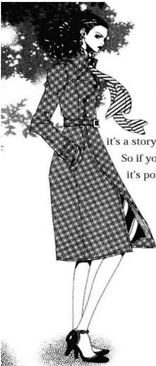
Nana© 2000, Ai Yazawa, Editorial Shueisha. Página 175

De acuerdo a la genealogía de formas de representación fijos/predeterminados de la mujer en el manga , la vestimenta de este personaje entra entre los estereotipos de “lolitas” el cual corresponde a Oeru o chica de oficina , las cuales siempre visten formalmente con trajes sastres. Este personaje es considerado en la categoría de “Mujer con agencia” debido a que se muestra como una mujer independiente y libre. Aunque no es una mujer que trabaje en una oficina, si es una mujer que trabaja en el ámbito de la docencia.