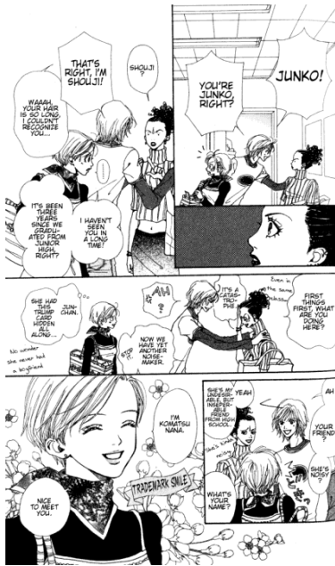
Nana© 2000, Ai Yazawa, Editorial Shueisha

Lo que diferencia a el manga con otras historietas y cómics es el tamaño y su forma de leerlo, estos se leen de derecha a izquierda 12 (Galicia, 1999:3). Son publicaciones semanales y mensuales dependiendo de la editorial, la duración de una publicación de manga está sujeta al autor, quien decide cuando pone fin a su historia esté o no concluida.