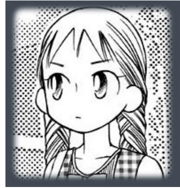
Kareshi Kanojo no jijou© 1996, Masami Tsuda. Editorial Hakusensha