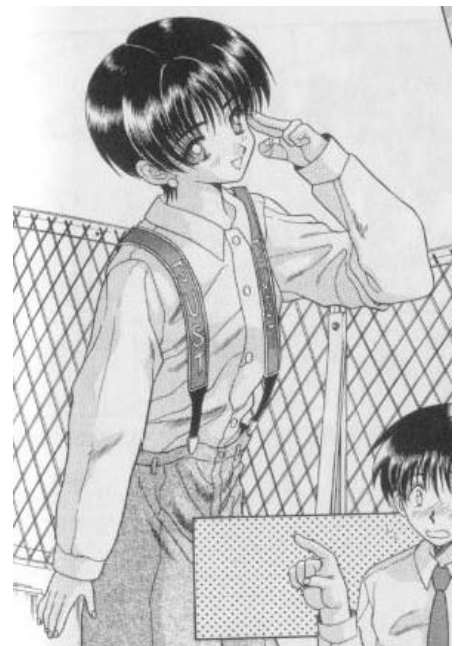
Yura y Makoto© 1997. Katsu Aki. Editorial Hakusensha. Página 124

La siguiente imagen corresponde al manga dirigido a adultos “Yura y Makoto”. Se muestra a una mujer en una posición activa, denotando alegría y felicidad en su actitud. Su vestimenta no es lo que se considera propiamente como “femenino” de acuerdo a los parámetros de belleza, ni tampoco lo que se muestra con los otros personajes. En cuanto a la presencia de símbolos que la relacionen con lo femenino y masculino, se muestran más símbolos asociados con lo masculino como el cabello corto, sus pantalones y su camisa. El único elemento relacionado con lo “femenino” son sus aretes.