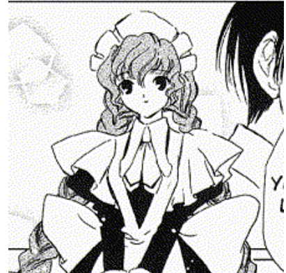
Chobits© 2001. CLAMP. Editorial Kodansha. Página 68.

Función en la trama: Es otra computadora que se representa con forma de mujer tiene el cabello muy largo, recogido en dos trenzas, estatura alta. Es una computadora muy servicial y sumisa.