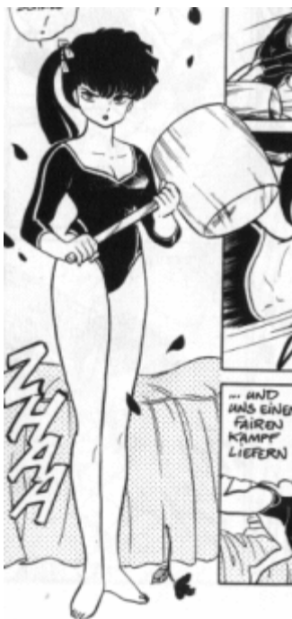
Ranma 1/2© 1987, Rumiko Takahashi. Editorial Shogakukan

• Yanderekkō o chica amorosa y “enfermiza” . Es un personaje que tiende a caer en lo extremo y sus inquietudes son las relaciones amorosas. Son mujeres que se muestran como tiernas y cariñosas pero en realidad tienen sentimientos contradictorios y llegan hasta la criminalidad para obtener lo que buscan, por ejemplo: matar a un hombre por infidelidad o a una mujer que interviene en sus relaciones amorosas.