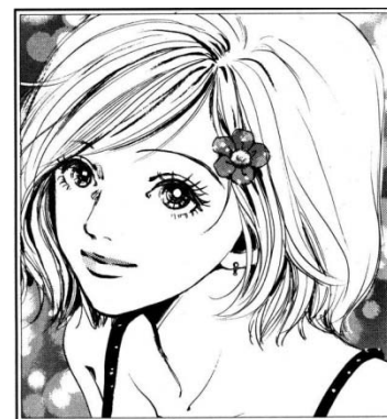
Nana© 2000, Ai Yazawa, Editorial Shueisha. Página 1

historias de dos chicas que salen a buscar a las parejas que las abandonaron. Se representa como una imagen delgada, cabello lacio, largo medio, estatura mediana. Nana es una mujer que se deja