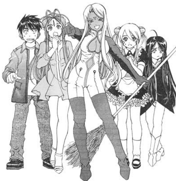
Aa! Megami Sama© 1988. Kosuke Fujishima. Editorial Kodansha

El shonen es la palabra japonesa que significa "muchacho o joven" (Schodt, 1986). Estas historias están dirigidas como su mismo nombre lo indica a hombres jóvenes hasta los 20 años. Los protagonistas de las historias están entre 15 y 17 años (Galicia, 1999:8). En este género manga la composición en los trazos no es tan decorada como en su contraparte el género shoujo (dirigido a las mujeres), el cual utiliza flores, estrellas y destellos en su elaboración.