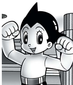
Astroboy © 1952, Osamu Tezuka. Editorial Kobunsha,

influencias de los comics norteamericanos en la revista The Japan Punch en colaboración con Charles Wirgman, un corresponsal de Estados Unidos del Illustrated London News definieron el estilo particular de Osamu Tezuka con grandes ojos y cabezas (Galicia, 1999: 15) basados en algunos dibujos como Betty Boop . Algunos lectores que tienen contacto por primera vez con el estilo manga creen que algunos de los rasgos de los dibujos se deben a un complejo que tienen los japoneses respecto al tamaño de sus ojos. Antes de la Segunda Guerra Mundial, los dibujos japoneses se representaban con ojos pequeños, característicos de la raza asiática, sin embargo después se dibujaron ojos extremadamente grandes. Schodot (1986:92), menciona que en Japón la cirugía plástica más común es la operación de ojos para hacerlos más grandes, sobretodo en las mujeres. Incluso en algunos manga dirigidos a mujeres se publicita un pegamento que sirve para pegar los párpados para que los ojos parezcan más grandes. A continuación en las dos imágenes de abajo, se observa el parecido del personaje japonés Astroboy (a la izquierda) con el personaje estadounidense Betty Boop (a la derecha), en ambos dibujos los ojos sobresalen y se nota la gran influencia de los personajes americanos en los japoneses.