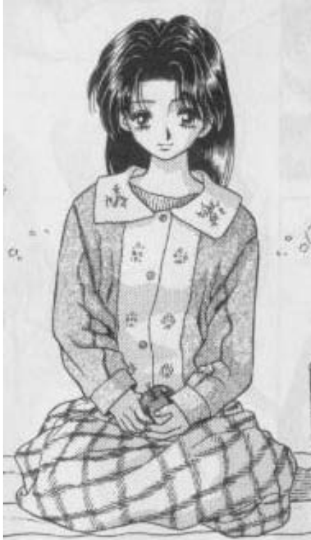
Yura y Makoto© 1997. Katsu Aki. Editorial Hakusensha. Página 3

Este término se refiere a las chicas que cometen diversos errores, sufren accidentes y nada les sale bien.