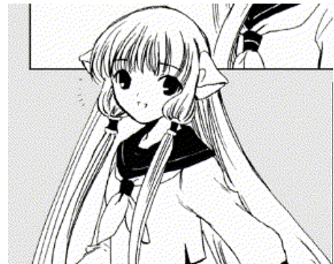
Chobits© 2001. CLAMP. Editorial Kodansha. Página 130.

Pertenece a las computadoras en forma humana llamadas perscom . Es una computadora que se representa en forma de mujer, de cabello largo hasta los tobillos, rubia, estatura baja, delgada. Su personalidad es sumamente infantil e inocente, realiza todo lo que el protagonista Hideki le ordena.