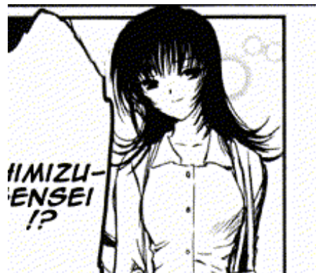
Chobits© 2001. CLAMP. Editorial Kodansha. Página 41.

Función en la trama: Es un personaje secundario. Es la profesora del personaje principal. Se representa como alguien insegura de si misma. Tiene el cabello largo, delgada.