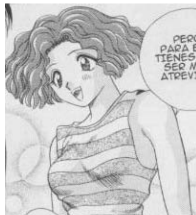
Yura y Makoto© 1997. Katsu Aki. Editorial Hakusensha. Página 100

trata de aconsejarla en sus relaciones sexuales. Es una mujer que complace en todo a su esposo y cree que es el mejor. Tiene cabello corto ondulado, delgada.