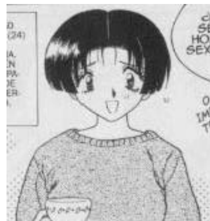
Yura y Makoto© 1997. Katsu Aki. Editorial Hakusensha. P3gina 20.

Otra amiga y ex compa#era de universidad de Yura que la aconseja sobre relaciones sexuales. Cabello corto, lacio delgada.