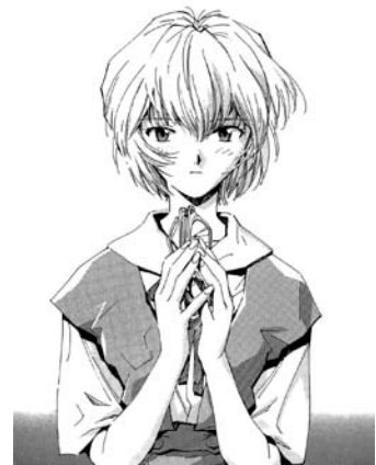
Neon Genesis Evangelion © 1995, Yoshiyuki Sadamoto. Editorial Kadokawa Shoten.