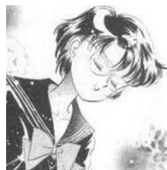
Bishoujo Senshi Sailor Moon© 1992, Naoko Takeuchi. Editorial Nakayoshi

• Meganekko o chica amorosa de lentes . Son personajes que usan lentes y tienden a ser muy inteligentes, en ocasiones son muy serias. La mayoría de las veces tienen el cabello largo.