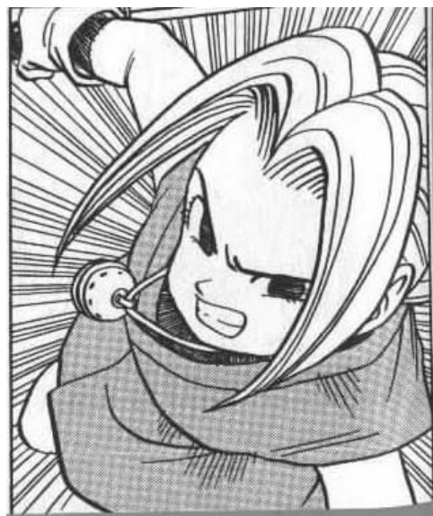
Kajika© 1998, Akira Toriyama. Editorial Shueisha. Página 17

La siguiente imagen fue seleccionada del manga para niños “Kajika”. Aquí se muestra al único personaje femenino de este material; se observa en una pose agresiva y muestra una actitud violenta. Su vestimenta en relación con los símbolos que la relacionan con lo femenino o masculino, están mejor ubicados en lo masculino. A simple vista no parece que se trate de una niña, sino más bien de un niño. Su complexión es delgada y su ropa no tiene relación alguna con lo “femenino”.