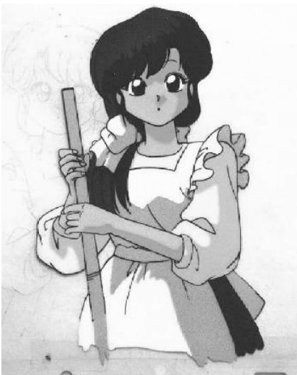
Ranma 1/2© 1987, Rumiko Takahashi. Editorial Shogakukan

• Yamato Nadeshiko o la mujer “ideal” . Este personaje representa el tipo “ideal” de mujer para los japoneses (Akamatsu, 1988), sumisa, cariñosa, servicial,