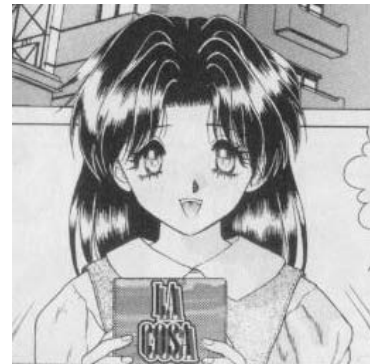
Yura y Makoto © 1997. Katsu Aki. Editorial Hakusensha. Página 139.

Función en la trama: Es el personaje principal. Es la esposa de Makoto. Se representa delgada, cabello largo y estatura media. En la historia se le muestra muy tímida y sumisa, sufría de hostigamiento sexual en el trabajo; se burlan de ella por ser inocente en los temas relacionados con el sexo. Su matrimonio fue arreglado, no escogió, por ella misma a su pareja sin embargo, ella aceptó al hombre que le escogieron, porque se dio cuenta que él no veía en ella sólo su