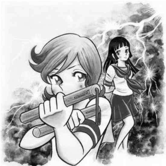
Oira Sukeban© 1974, Go Nagai. Editorial Shogakukan