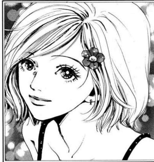
Nana© 2000, Ai Yazawa, Editorial Shueisha. Página 1

La siguiente fue tomada del manga para mujeres “Nana”. Aquí se presenta una imagen que muestra a un personaje femenino en una actitud pasiva. Se trata de una mujer joven que luce muy delgada y sus rasgos no van de acuerdo a la imagen de una mujer japonesa, si no que corresponden al de una mujer de occidente.