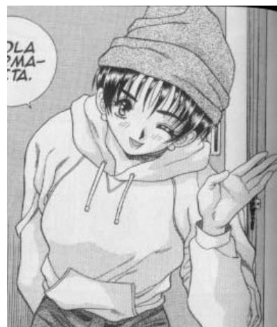
Yura y Makoto© 1997. Katsu Aki. Editorial Hakusensha. Página 127.

experiencia en las relaciones sexuales y trata por todos los medios que su hermana conozca su cuerpo y sea una experta en el tema. También interviene en la vida de Makoto, para que logre satisfacer sexualmente a Yura. Rika se presenta como una estudiante de universidad que empezó su vida sexual muy temprana. No tiene complejos ni inseguridades, no le gusta depender de nadie, en especial de los hombres, los cuales sólo los utiliza para el sexo.