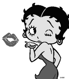
Betty Boop © 2013 King Features Syndicate, Inc./Fleischer Studios, Inc.

La historia que llevó a la cumbre a Osamu Tezuka fue Astroboy , donde se notaba su dolor por lo ocurrido en la guerra mostrando una ciudad futurista renovada después de este suceso, con