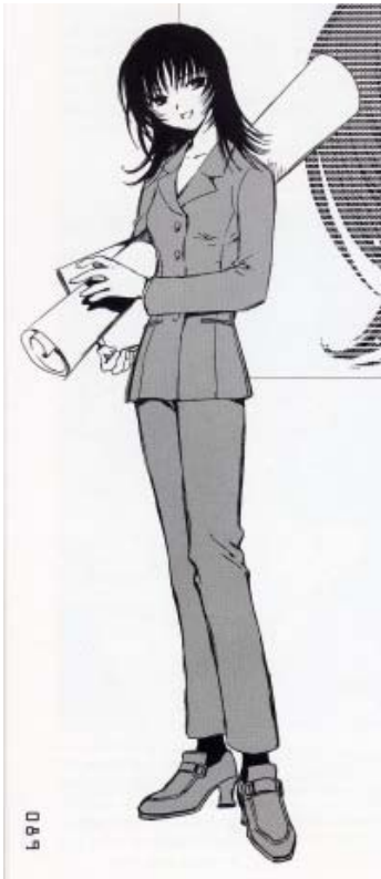
Chobits© 2001. CLAMP. Editorial Kodansha. Página 41

Esta primera imagen es del manga dirigido a público masculino “Chobits”, donde se muestra a un personaje femenino que representa a una mujer con agencia. Se muestra muy delgada y joven, su pose denota importancia e inteligencia. De acuerdo a lo dicho por Barthes (1986: 17) la forma de la posición de una imagen denota una variedad de significados en especial simbólicos, elementos como una libreta y un mapa en conjunto con su vestimenta de traje sastre de pantalón, hablan de una actitud que no es pasiva y la colocan como una imagen que demuestra que se trata de una mujer que se desenvuelve perfectamente en el ámbito laboral.