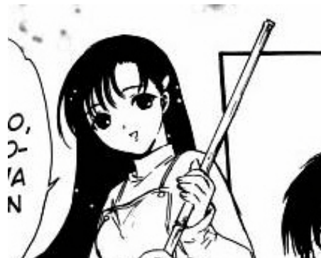
Chobits© 2001. CLAMP. Editorial Kodansha. Página 57.