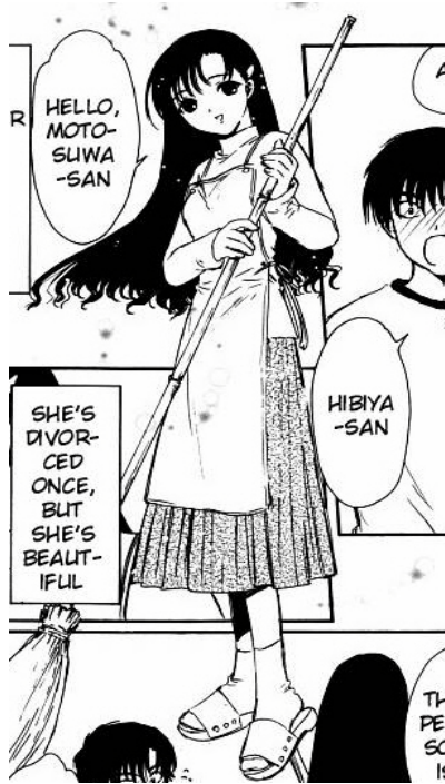
Chobits© 2001. CLAMP. Editorial Kodansha. Página 57

El personaje femenino que se presenta en esta imagen corresponde al manga dirigido a hombres “Chobits”. Aquí se muestra a una mujer en una pose que denota gran pasividad. Su vestimenta habla de una mujer que de acuerdo a los símbolos en relación a lo femenino representaría a una ama de casa con ropa cómoda y delantal, incluso en esta imagen se muestra barriendo la calle.