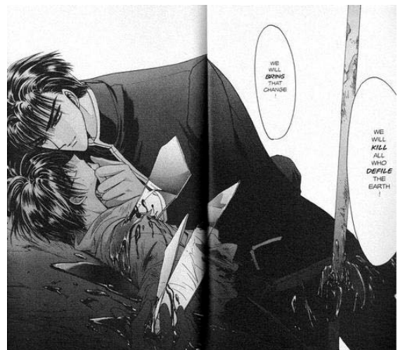
X© 1992, CLAMP, Editorial Kadokawa Shoten

Los mangas también pueden ser llamados Komikku palabra retomada del inglés que significa cómic (Rojas, 2001:1). La pronunciación japonesa lo expresa como Komikku . En cuanto a su estructura, el