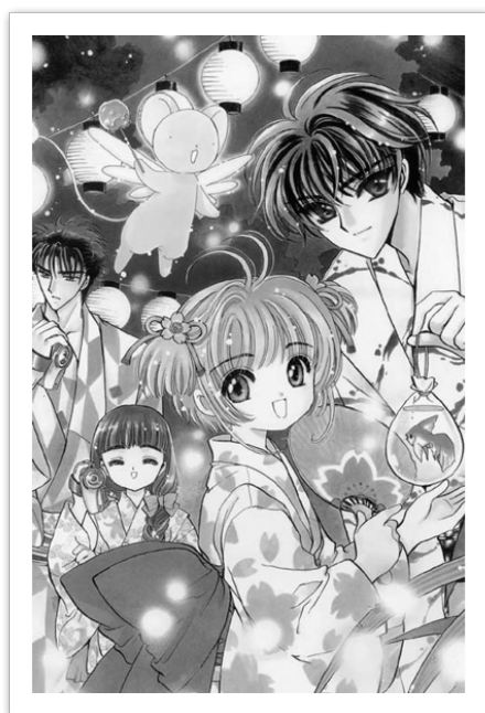
Card Captor Sakura© 1996. CLAMP. Editorial Kodansha

Algunas leyes cambiaron y favorecieron en varios aspectos a la mujer (Akamatsu, 1998:25),