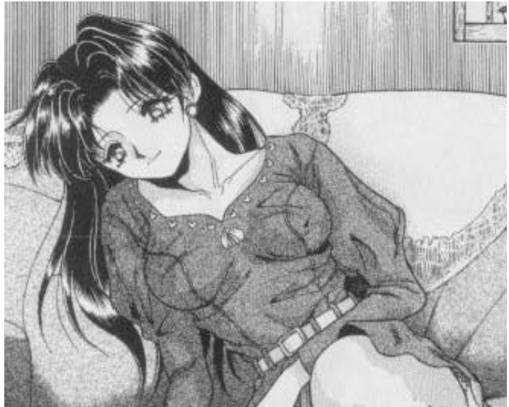
Yura y Makoto© 1997. Katsu Aki. Editorial Hakusensha. Página 155

En esta imagen se presenta a un personaje del manga para adultos “Yura y Makoto”. El personaje se encuentra en una pose que denota sensualidad e ingenuidad, es una mujer que tiene una complexión delgada, sin embargo tiene un busto prominente. Es una imagen que contiene diversos símbolos que se relacionan con lo femenino, empezando porque se presenta a una mujer con cabello muy largo, un vestido y aretes grandes.