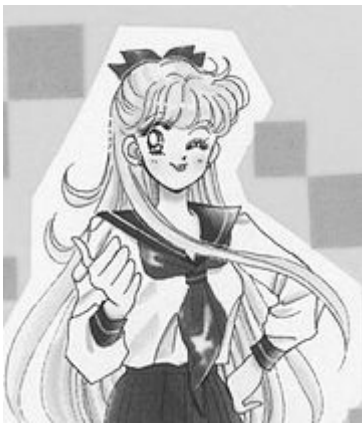
Bishoujo Senshi Sailor Moon© 1992, Naoko Takeuchi. Editorial Nakayoshi