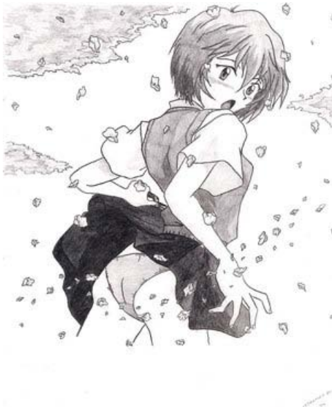
Neon Genesis Evangelion © 1995, Yoshiyuki Sadamoto. Editorial Kadokawa Shoten.

A pesar de la corta edad de los personajes, sus cuerpos se muestran completamente desarrollados como los de una mujer adulta. Por lo que son una combinación entre niña y mujer. Principalmente en las historias dirigidas a los hombres jóvenes ( shonen ) es que se muestra en mayor medida a este tipo de personajes con mujeres en ropa interior y obteniendo favores gracias a sus físico infantil. También se dan infinidad de situaciones que muestran la ropa interior de las mujeres “accidentalmente” (como una corriente de aire que levanta sus faldas, una caída en cualquier lugar o el simple hecho de bañarse) a esto se le llama en Japón Fan Service 33 y era exclusivo de las historias Shonen . En la época de la posguerra, se incluyó en gran medida el desnudo en las publicaciones, aunque no tuvieran una connotación sexual, atrajo masivamente a los lectores masculinos lo que contribuyó a las fuertes críticas hacia estos medios visuales.