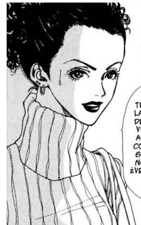
Nana© 2000, Ai Yazawa, Editorial Shueisha. Página 21

como una mujer independiente, segura de sí misma, que sabe lo que quiere y que a diferencia del personaje principal Nana Komatsu no depende de sus relaciones amorosas y consigue lo que quiere. Es delgada, alta, cabello rizado y largo.