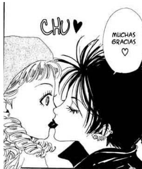
Nana© 2000, Ai Yazawa, Editorial Shueisha. Página 108

En esta otra imagen vemos al mismo personaje besando a otra mujer en forma de agradecimiento, lo que sigue rompiendo con las características estrictas que se construyen socialmente del género respecto a las mujeres, a la vez que se puede observar una situación que en la mayoría de las historietas occidentales no ocurriría, cabe recordar que para las mujeres japonesas el amor “puro y sincero” se da sólo entre las personas del mismo sexo, por lo que es más frecuentemente ver estas situaciones en historietas del género dirigido a mujeres shoujo .