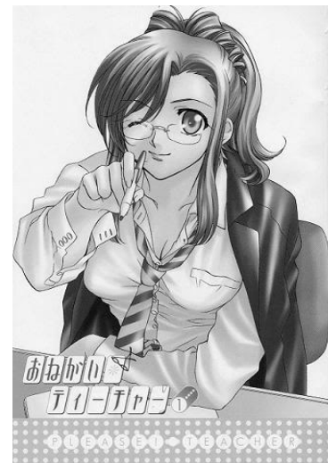
Onegai Teacher© 2002, Shizuru Hayashiya. Editorial Editorial ASCII MediaWorks

• Oeru o chica de oficina . Los personajes suelen vestir con trajes sastres, lentes y usar el cabello suelto o peinado en un “chongo”. Representan a la mujer que trabaja todo el día y goza de éxito profesional.