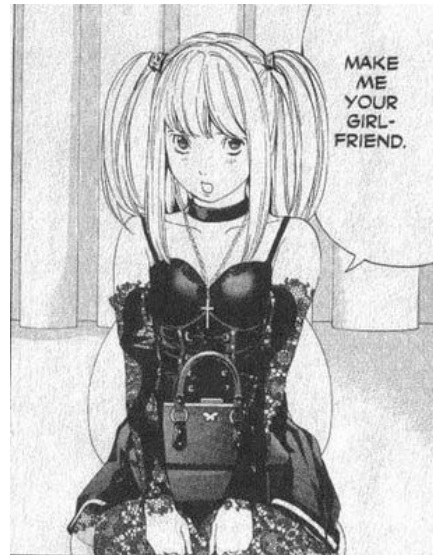
Death Note© 2003, Tsugumi Oba, Takeshi Obata. Editorial Shueisha

tiempo por ser un lugar donde se puede adquirir lo último en moda (Ortiz, 2008). Cada fin