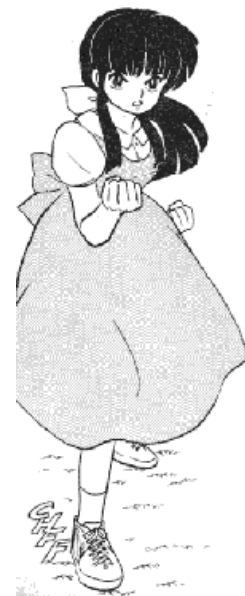
Ranma 1/2 © 1987, Rumiko Takahashi. Editorial Shogakukan