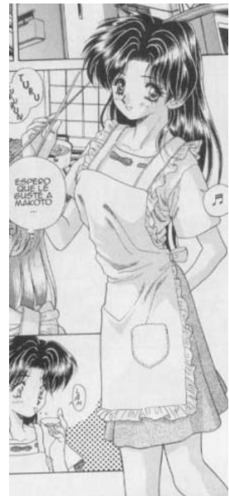
Yura y Makoto© 1997. Katsu Aki. Editorial Hakusensha. Página 166

En la identificación de genealogía de formas de representación fijos/predeterminados de la mujer en el manga este personaje representa a Yamato Nadeshiko o la mujer “ideal” como se había mencionado anteriormente,