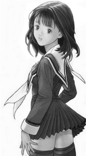
Video Girl Ai© 1989, Masakazu Katsura. Editorial Shueisha.

La importancia que se le otorga a la mujeres en el manga de cualquier género es muy