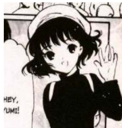
Chobits© 2001. CLAMP. Editorial Kodansha. Página 113

Función en la trama: Es un personaje secundario.