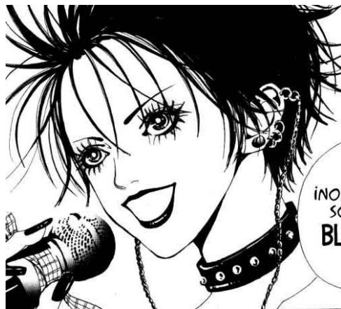
Nana© 2000, Ai Yazawa, Editorial Shueisha. Página 105.