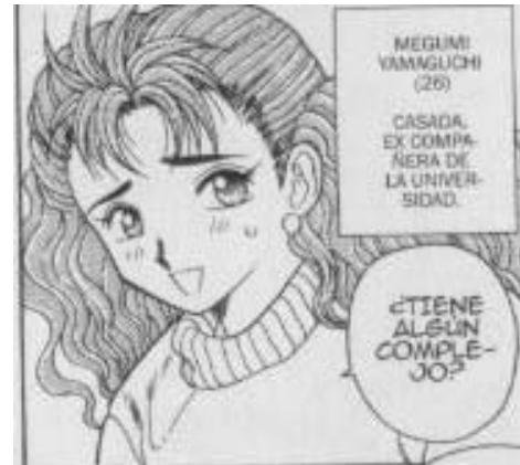
Yura y Makoto© 1997. Katsu Aki. Editorial Hakusensha. P3gina 20.

Aparece s3lo para dar consejos. Es una mujer que habla con toda libertad de la sexualidad. Tiene cabello largo ondulado, delgada.