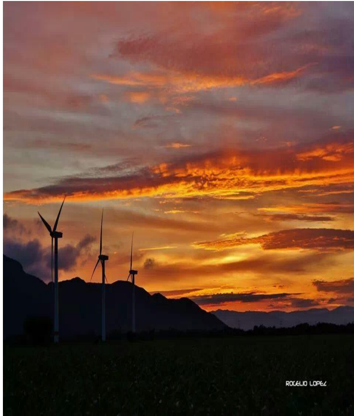
Autor: Rogelio López. (30, sep, 2013) La Ventosa Juch. Oax.