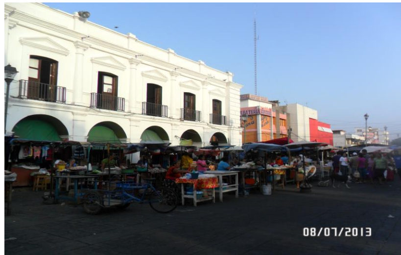
Autor: Lozada Díaz Leslie L. Mercado Informal, fuera del Palacio Municipal de Juchitán de Zaragoza, Oax.

Dicho lo anterior, en cuanto al comercio informal me atrevería a decir que es el más trascendental en el sexo femenino, pues las mujeres zapotecas se destacan por su carácter dominante y así mismo por ser trabajadoras, administradoras y apoyar al sostenimiento de sus hogares, junto a su pareja o bien como madres solteras. Es por ello que es el más practicado, pues tanto en las calles como fuera del mercado y actualmente fuera de las empresas eólicas, los comerciantes ofrecen una gran variedad de productos, en especial, la comida que es la que más se vende y buscan tanto los turistas, trabajadores, estudiantes o bien las mismas amas de casa que no tienen el tiempo para hacer de comer.