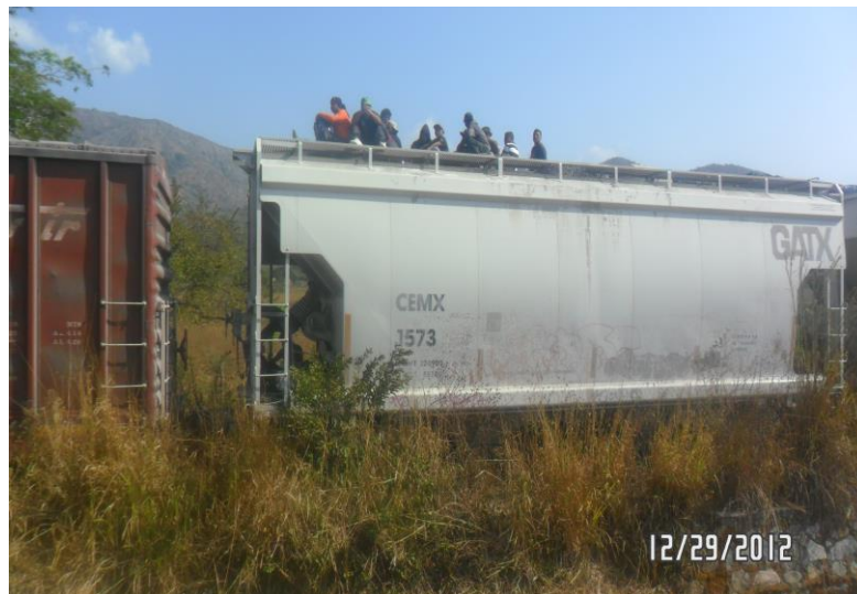
Tren la "bestia" en la parte de arriba del tren se pueden ver los migrantes indocumentados de los diferentes Estados.

Al respecto, el caso de la migración en la Ventosa es algo particular que deseo destacar a continuación. Los pobladores antes de la llegada de los ventiladores eran pocos, la cifra que dio a conocer el INEGI en el año 2005 era de 4 201 habitantes. Por lo que conocí hace unos 6 o 7 años aproximadamente en el aspecto material el poblado tenía casas de un piso y la construcción pequeña a pesar de que el terreno era grande una que otra era la que destacaba del pueblo, obviamente era la que pertenecía al cacique del pueblo; la gente laboraba en el campo, la ganadería y el comercio informal eran los oficios más desempeñados, muy pocos podían acceder a una profesión o a un buen trabajo. Preferían salir de la Ventosa antes que quedarse ahí a esperar su suerte, hombres principalmente migraban para Estados Unidos, si tenían la oportunidad, otros se iban al Distrito Federal en busca de un mejor futuro o bien a otro estado de la República donde les corría el rumor de que había trabajo.