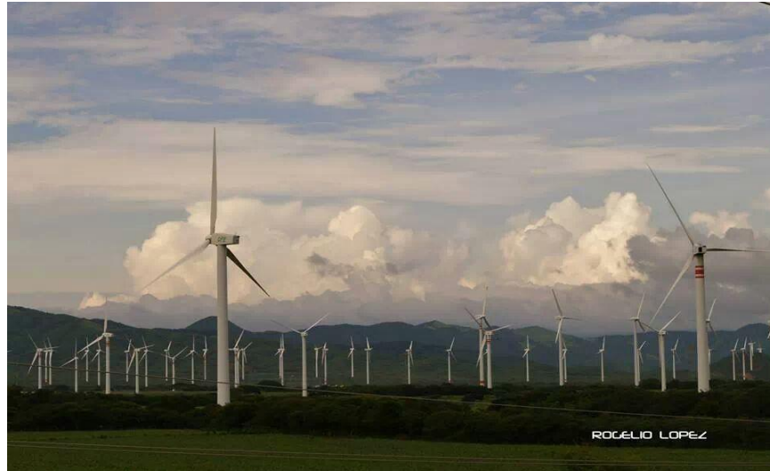
Autor Rogelio López. Parques Eólicos establecidos en terrenos ventoseños.

Debido a esto el gobierno de Oaxaca gestionó ante los laboratorios nacionales de Energía Renovables de Estados Unidos un estudio sobre el potencial eólico en dicha región, este estudio fue financiado con recursos del Programa de las Naciones Unidas para el desarrollo (PNUD) y la Agencia de los Estados Unidos para el Desarrollo Internacional (USAID) (Henestroza, 2009, p.40).