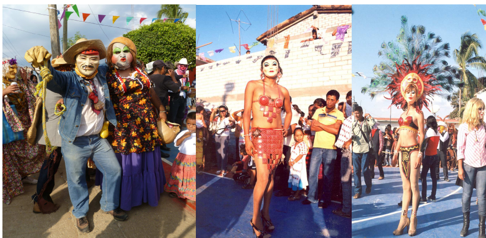
Danzantes de las mascaritas