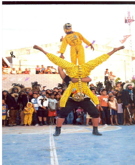
Danza del tigre y el toro