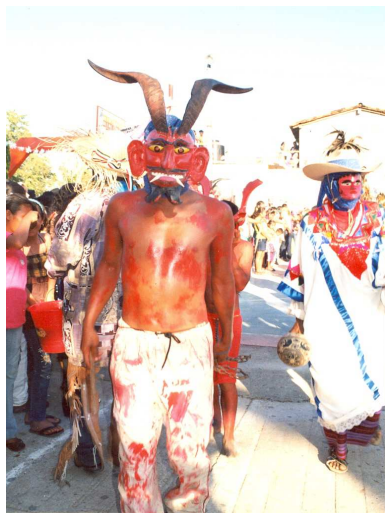
Danzante de los diablos

Esta danza anteriormente era bailada por adultos, pero en la actualidad es casi exclusiva de los jóvenes-adolescentes. Éstos están semidesnudos (con sus partes íntimas cubiertas) y se pintan el resto del cuerpo con tizne o pintura roja. Se cubren el rostro con paliacates, lentes oscuros o máscaras de huesos o de madera.