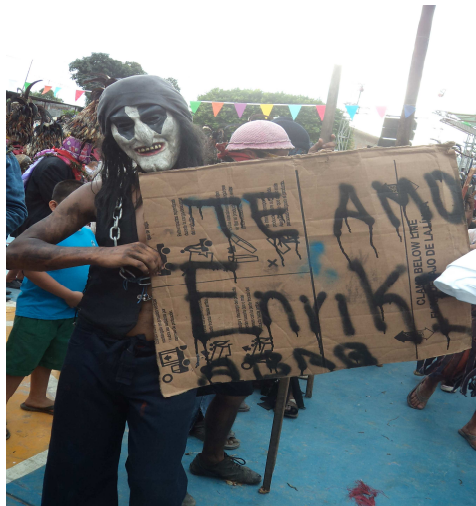
Carnaval del PRD, 2012

Las imágenes anteriores nos muestran el contraste de bailar en el carnaval del PRI o del PRD. Ambas tomas como personaje a parodiar al presidente de la administración 2010-2012 y en el carnaval del PRI es para mofarse de su persona y en el carnaval del PRD para mostrarle apoyo o afecto.