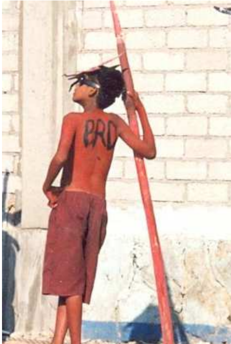
Danzante de los diablos, carnaval PRD, 2011

Otro ejemplo es que uno de los danzantes de los diablos se pintó las iniciales del PRD en la espalda, lo que quiso decir es que es un danzante del carnaval de ese partido.