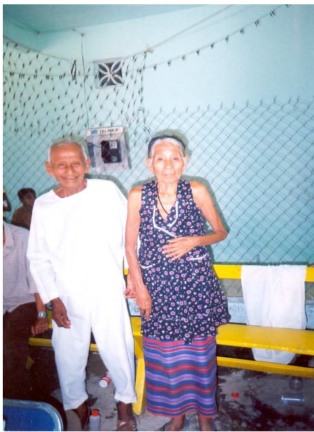
Vestimenta cotidiana de hombres y mujeres

es una tela blanca rectangular que cubre la espalda y un pozahuanco o enredo, que va enredada de la cintura a los pies y que es una tela de hilos tejidos púrpura, azul y guinda. La única manera de producir este pozahuanco es tejiéndolo y bordándolo en telar de cintura, pero como el proceso es largo, muchas mujeres mixtecas de la región han dejado de ejercer esta práctica y prefieren comprarlo a las que aún la realizan. Para el caso de las mujeres de Ñuu Ndo Yu'ú, Pinotepa de Don Luis, muchas de ellas tejen y bordan pozahuancos, servilletas y blusas, que después venden en los otros pueblos como Jicayán y Pinotepa Nacional, principalmente.