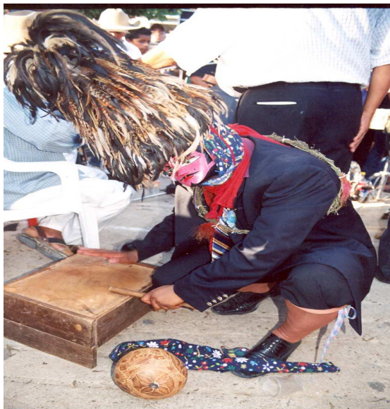
Danzante de los tejorones

De los cambios más visibles que se han percibido en esta danza es en que ya hay gente mestiza que se anima a bailarla, puede ser un candidato político que quiere ganar simpatía o el mismo proceso de intercambio de diferencias culturales y también la vestimenta, ya que cada vez es más elegante el atuendo, cuando antes la prioridad no era que la ropa fuera nueva, elegante o no, sino la situación de mofarse del otro: español o mestizo.