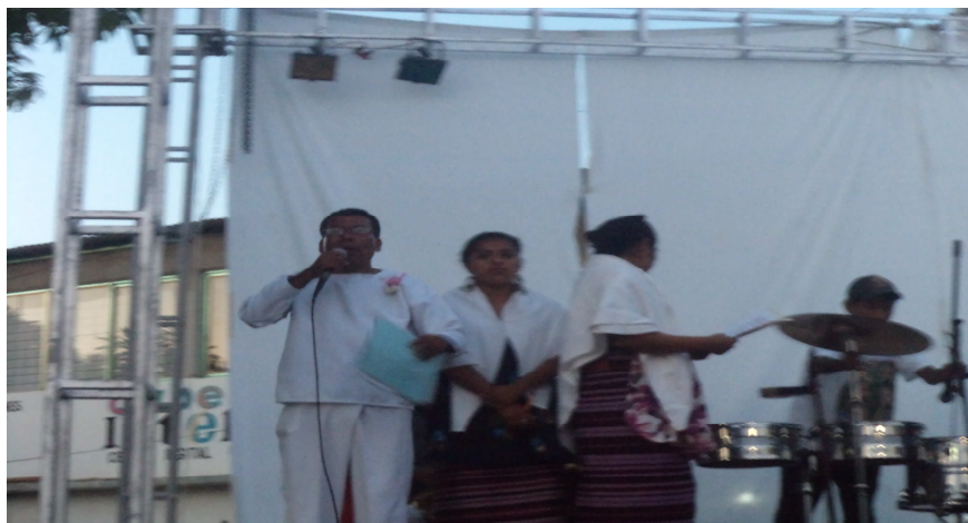
Maestros de ceremonias del carnaval del PRI, 2011