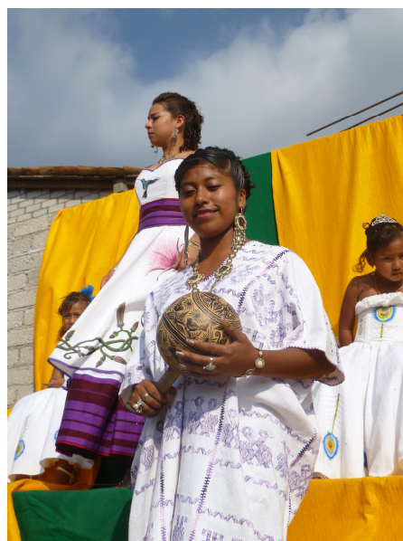
Reinas del carnaval del PRD, 2012