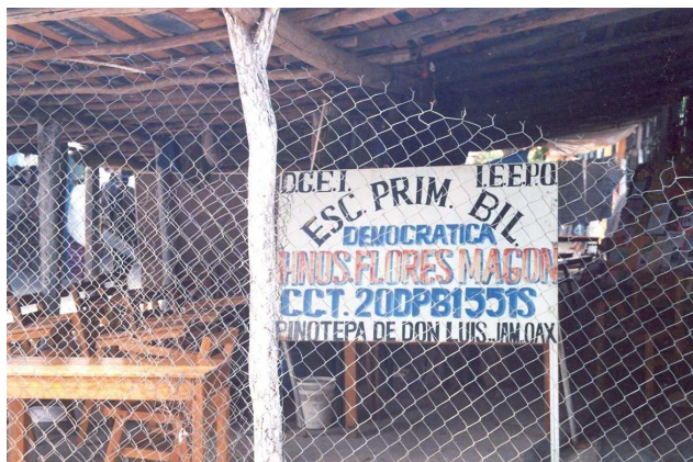
Escuela Primaria Bilingüe Democrática Hermanos Flores Magón

Y qué mejor espacio que el carnaval para expresar sus posturas políticas, ideológicas, individuales y colectivas. En el siguiente capítulo abordaré con más profundidad cómo fue el proceso de apropiación del carnaval por ambos grupos y la manera en que construyeron y disputaron sus rivalidades a través de los elementos discursivos del carnaval.