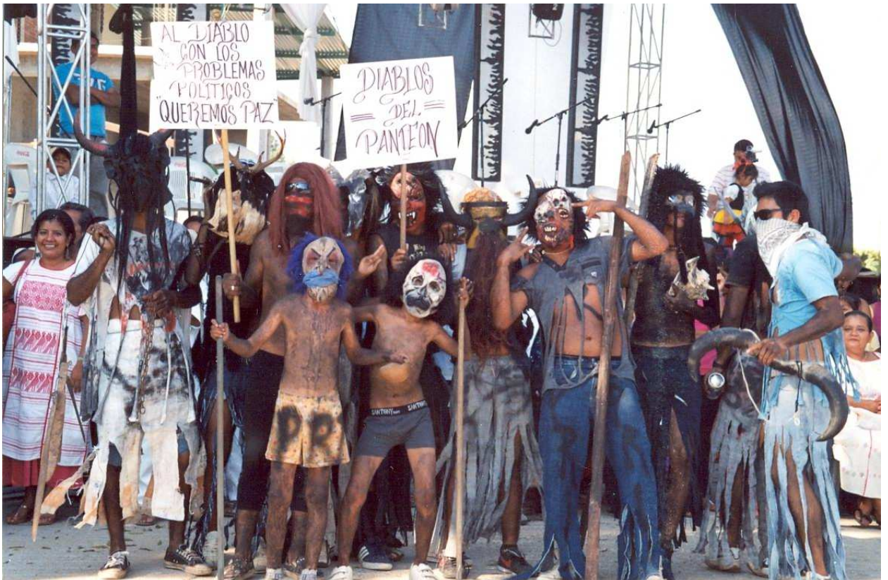
Danzantes de los diablos, 2011