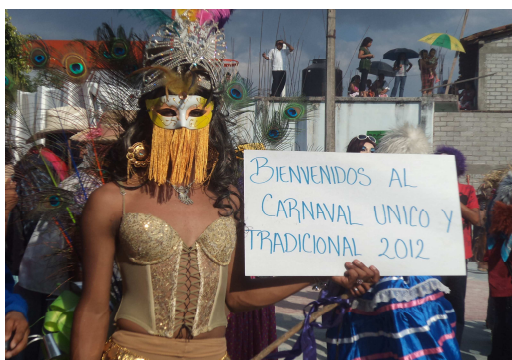
Carnaval del PRI, 2012

Esta disputa se ve también en el discurso oral, ya que en el carnaval del PRI, cuando referían al carnaval lo llamaban nuestro carnaval indígena , haciendo explícita la importancia de lo étnico, como un rasgo identitario y definitorio de su proceso de organización y celebración y al carnaval del PRD lo llamaban el carnaval de Pinotepa de Don Luis . Cabe mencionar que el asunto de nombramiento de lo mestizo no es un proceso de autodenominación, sino que es definido desde la otredad no mestiza. Por lo que el carnaval del PRD no se autodenominó como el carnaval mestizo, pero tampoco podía nombrarse indígena, así que hizo alusión a una cuestión más general al llamarse el carnaval de Pinotepa de Don Luis .