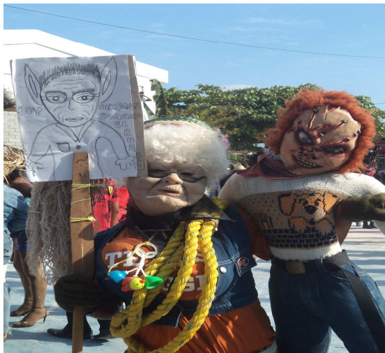
Carnaval del PRI, 2012

de la posible filtración de los grupos y sujetos dominantes al carnaval, hay un espacio que si es propio del pueblo, construido por los habitantes de la comunidad según su rol social o su condición étnica, política y económica.