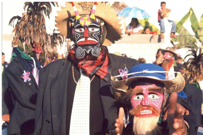
Tejoron de máscara negra y viejo

Por ejemplo la danza de “las mascaritas en Huazolotitlán, es el espacio de reivindicación de los homosexuales sobre su sexualidad, casi es una danza exclusiva de ellos y aunque no todos los que la bailan lo son, sí la mayoría. Para el caso de la danza de los “tejorones”, en San Andrés Huaxpaltepec, hay dos tipos de “tejorones”, los que son más parecidos a los de Don Luis y los “tejorones” de máscara negra, esto se explica porque en la localidad, la población a parte de estar compuesta por gente mestiza e indígena, está compuesta por un porcentaje de población afroamericana.