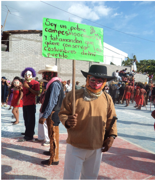
Danzante del carnaval del PRI, 2011