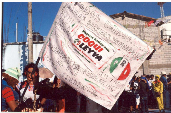
Carnaval del PRI, 2011

Por otro lado, en el carnaval del PRI un danzante de la misma danza llevaba un letrero que decía: Todos unidos...jamás seremos vencidos “; I’m the king , bajo el logotipo del PRI coronado.