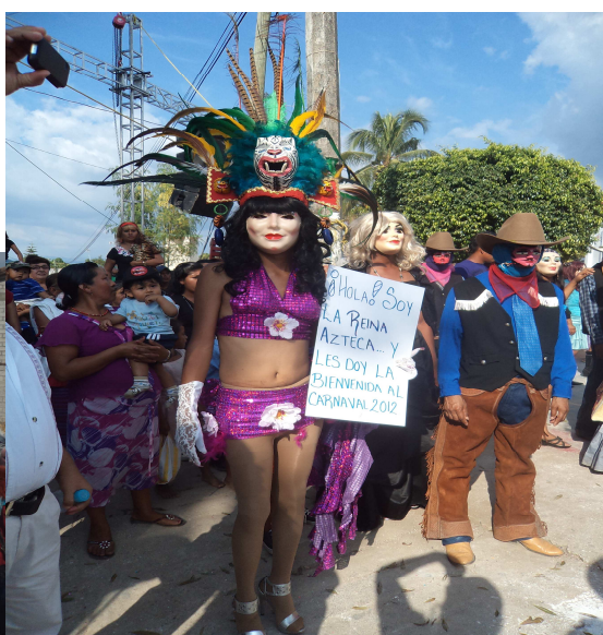
Carnaval del PRD, 2012