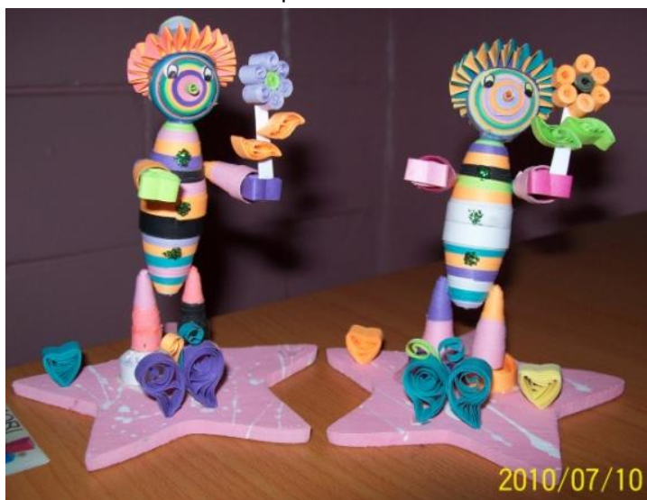
Fig. 1 Payasitos de Colores

Elaborados con tiras de papel de colores, silicón, plumones, diamantinas y una base de madera pintada.