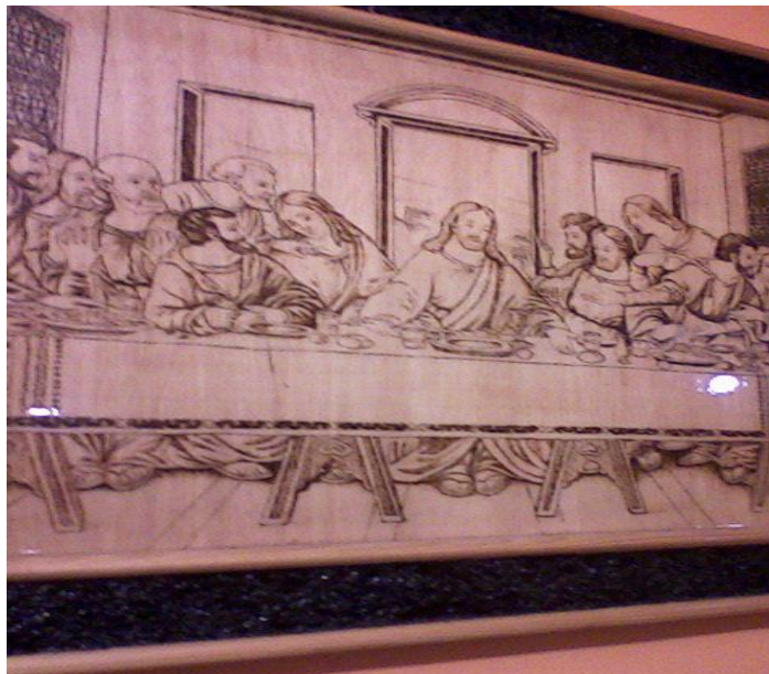
Fig. 6 Cuadro ultima cena

Elaborada en madera con pirógrafo, el marco es de café en grano molido, cubierto por resina.