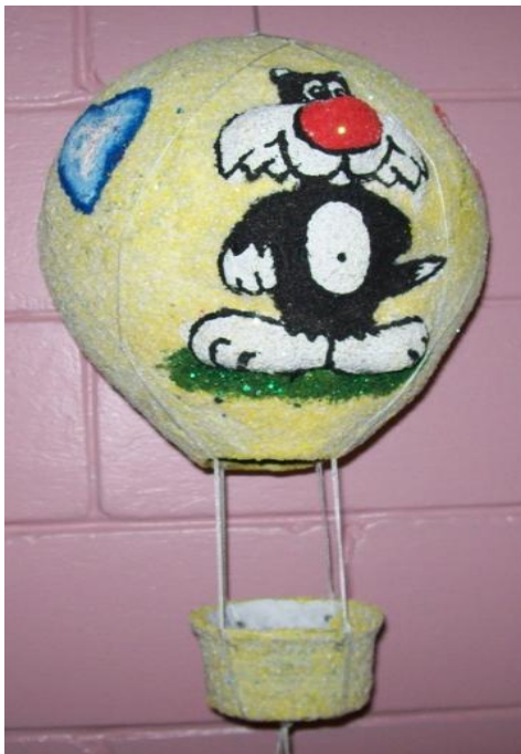
Fig. 4 Globo Aerostático

Elaborado con papel periódico, engrudo, Tirol, pinturas, hilo.