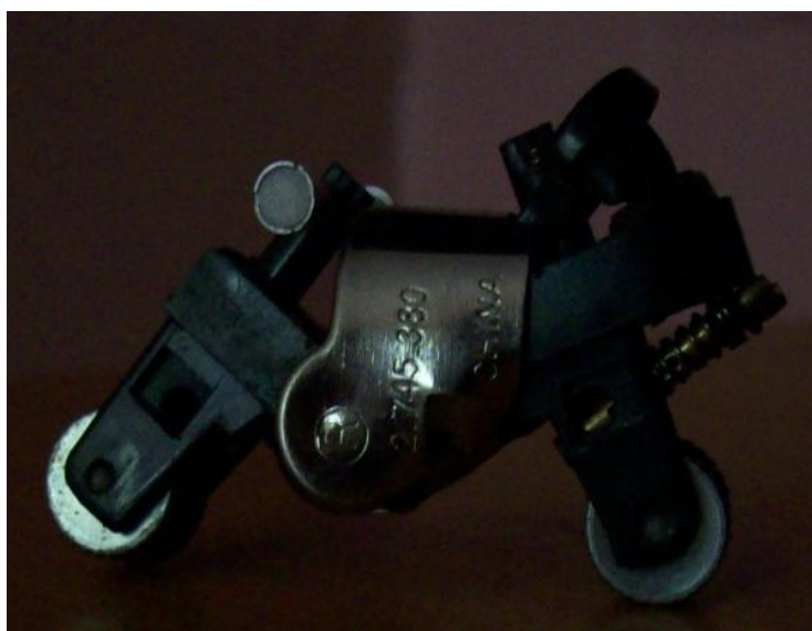
Fig. 2 Motocicleta

Elaborada con las diferentes partes de un encendedor