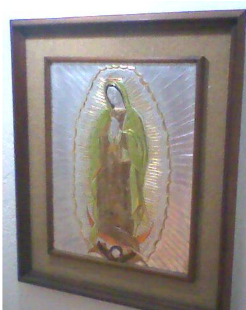
Fig. 7 Cuadro Guadalupano

Elaborado en estaño, bajo la técnica de repujado, el marco es de madera