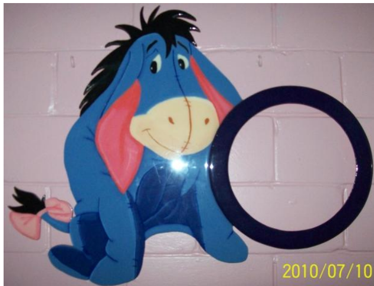
Fig. 3 Porta Espejo

Elaborado en madera, pinturas y cubierto con resina, en el círculo se incrusta un espejo.