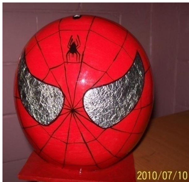
Fig. 8 Alcancía Hombre Araña

Elaborada con papel periódico, pinturas, engrudo o pegamento, papel estaño, y una base de madera.