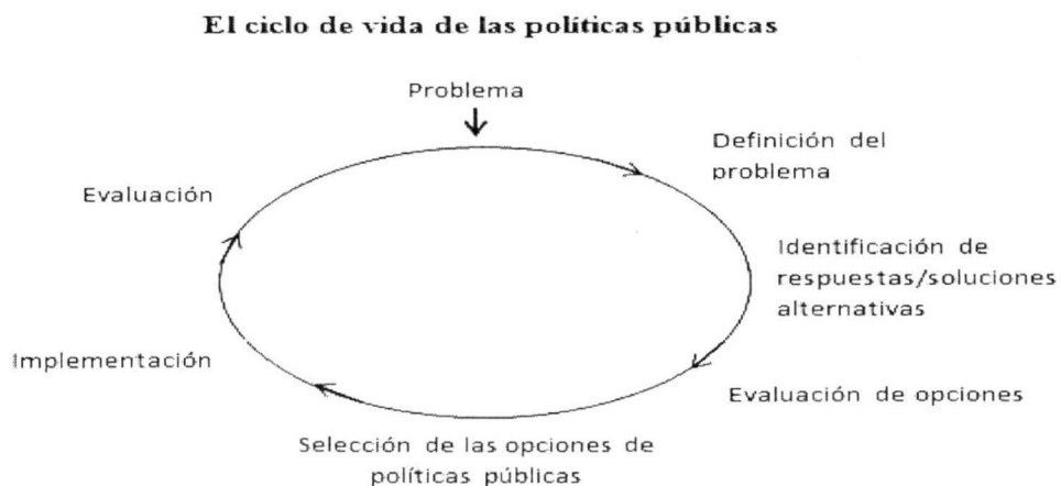
Cuadro 3 Wayne Parson:

Por otro lado, Wayne Parsons hace referencia a que el ciclo de las PP o enfoque "por etapas" siguen siendo la base tanto del análisis del proceso de la PP como del análisis en y para el proceso de las mismas, como se observa en el Cuadro 3.